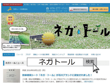
ウェブには施工事例も掲載

品が売上の柱となっていますが、本製品の供給は県内外に広がりつつあり、売上の三本目の柱に成長させるべく、現在、製品の研究に積極的に取り組んでいます。